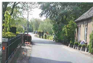
verkeer, Schokland en water